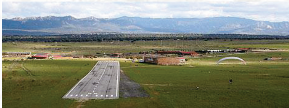
LEE9 – Aldeacentenera