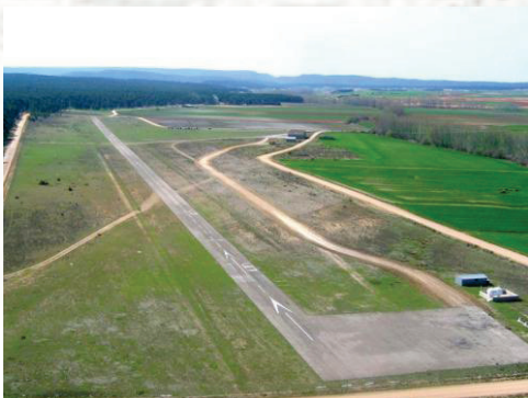
LESS – Sotos 3.168' AMSL RWY 16/34 – 2.929'