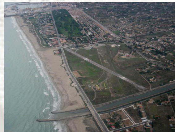
LECN – Castellón 17' AMSL RWY 03/21 – 2.723' RWY 18/36 – 1.500'