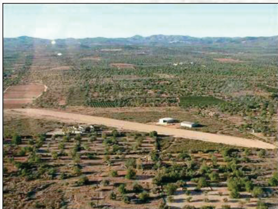
LE03 – Vinaroz 350' AMSL RWY 18/36 – 1.350'