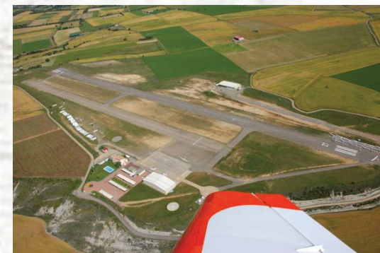
LECI – Santa Cilia 2.249' AMSL RWY 09L/27R – 2.789' RWY 09R/27L – 2.231'

Estamos ante otra preciosa etapa en la que no hay que tener prisa, ni mucho menos. Se trata de relajarse y disfrutar del espléndido paisaje de los Pirineos. 7 etapas atrás os dije que estábamos ante la única etapa internacional de esta Vuelta a España VFR. Pues nada más lejos de la realidad, ya que hoy os propongo un trayecto más internacional que el de la etapa 15 si cabe, ya que no vamos a visitar un país, sino dos, Francia y Andorra.