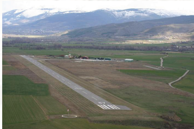
LECD – La Cerdaña 3.585' AMSL RWY 07/25 – 3.776'