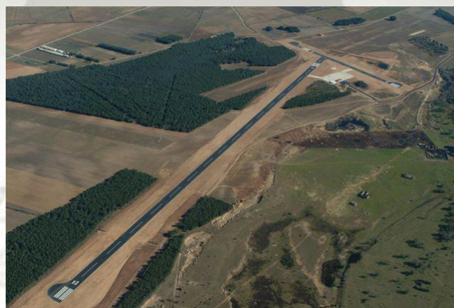
LE25 – Garray 3.359' AMSL RWY 02/20 – 1.706' RWY 09/27 – 4.429'

Dejamos atrás el campo de vuelo de Campillos-Paravientos en rumbo NNE para dirigirnos directamente al Embalse del Arquillo, situado sobre el Río Turia en las inmediaciones de Teruel. Continuamos en este rumbo para encontrar a pocas millas, y casi paralela a la autovía A23, una línea férrea que nos llevará de la mano hasta Soria. Antes de llegar a Calatayud nos acompañará el Río Jiloca en buena parte de nuestro recorrido. Pasando Calatayud ese papel de guía, por si no nos bastara con la línea férrea, lo jugará el Río Jalón. El aeródromo de Numancia-Garray se encuentra a 5NM escasas al N de Soria.