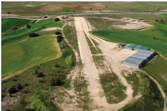
LED4 - Brunete 2.030' AMSL RWY 17/35 – 1.312'