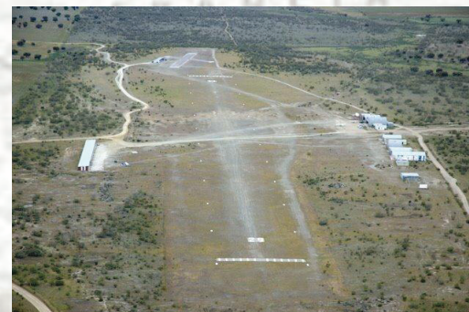
LEE3 – Valdesalor 1.345' AMSL RWY 10/28 – 3.117'

Una vez contamos con el permiso para despegar de quien ya sabéis, nos vamos al aire y ponemos rumbo a Badajoz, siguiendo la carretera N-430. Pasando Santa Amalia, y poco antes de llegar al pequeño Embalse de Cerros Verdes, la N-430 confluye con la autovía A-5. En este punto viramos a rumbo NO y a unas 11NM estaremos sobrevolando la Autovía A-66, también conocida como Ruta de la Plata, que une Gijón con Sevilla; y la cuál seguimos hacia Cáceres. El campo de vuelo de Valdesalor se encuentra sobre la margen izquierda de la autovía, en el sentido de nuestra marcha, unas 3NM al S del pueblo que le da nombre y 2,5NM al SO del Embalse de Salor.